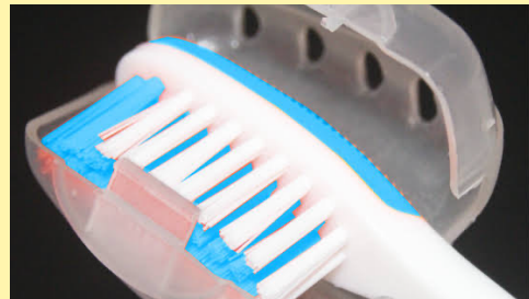
cerdas da escova em ação removendo a placa bacteriana aderida ao dente

As escovas podem ser meios para germes, bactérias e fungos, que podem se multiplicar. Por isso, além de uma escova dental nova, é preciso prestar atenção à forma como ela é guardada após o uso. Para preservar a sua escova e a sua saúde, lave bem as cerdas sob água corrente para remover todos os resíduos depois de usar, e em